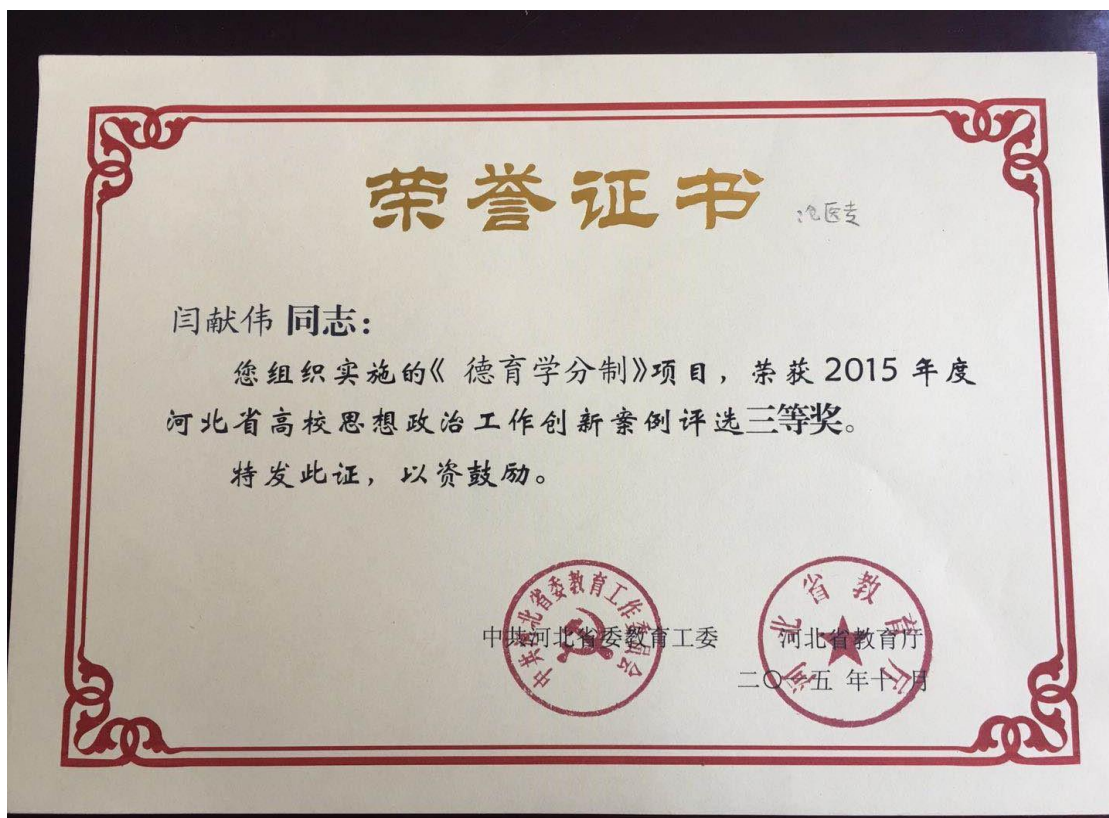
获奖——河北省高校思想政治工作创新案例三等奖