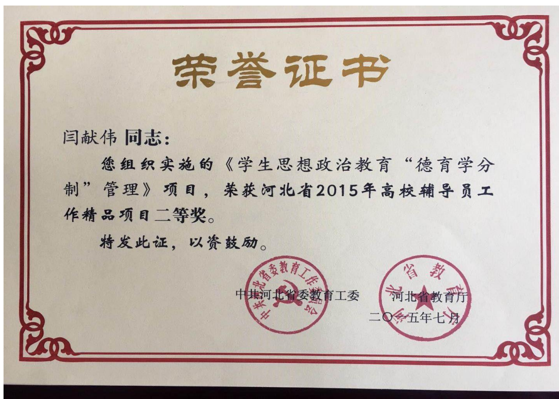
获奖——辅导员工作精品项目二等奖