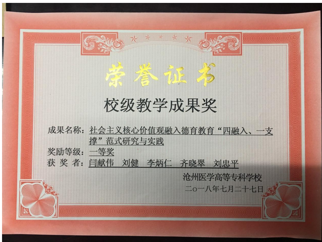
获奖——学校职业教育教学成果一等奖