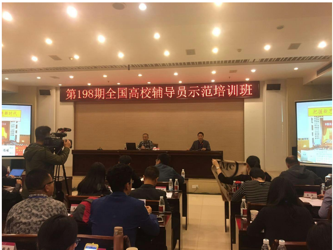
推广——在第198期全国高校辅导员示范培训班上做典型经验发言